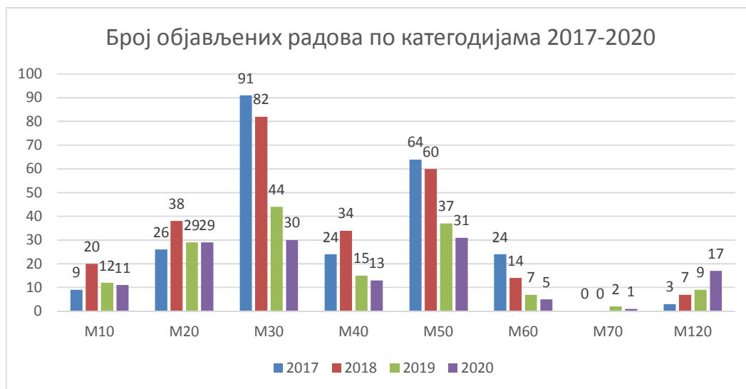
Графикон 1. Број објављених радова по категоријама у периоду 2017–2020. година

Како би се дао бољи увид у стање у претходном периоду, број радова истраживача Института објављених у периоду 2017–2020. година је приказан на Графикону 1.