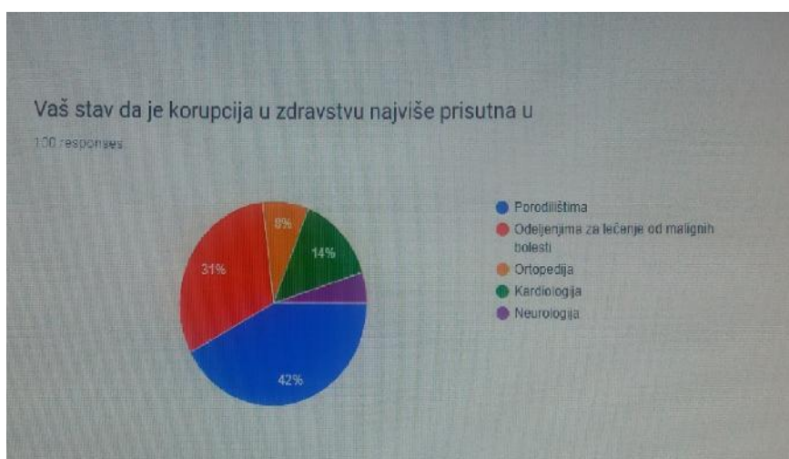
Slika 3. Statistički prikaz stava ispitanika o prisustvu korupcije u određenim zdravstvenim sektorima

Na pitanje u kom zdravstvenom sektoru smatraju da je korupcija najzastupljenija, 42% je odgovorilo u porodilištima, 31% na odeljenjima za maligne bolesti, kardiologiji 14%, na odeljenju ortopedije 8% i na neurologiji 5% (Slika 3).