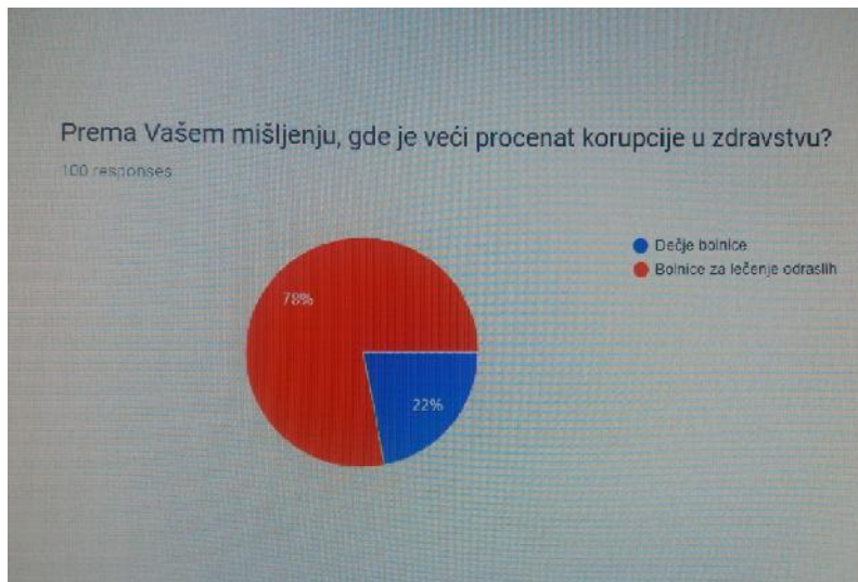
Slika 2. Rezultati sprovođenja ankete

Na pitanje u kom zdravstvenom sektoru smatraju da je korupcija najzastupljenija, 42% je odgovorilo u porodilištima, 31% na odeljenjima za maligne bolesti, kardiologiji 14%, na odeljenju ortopedije 8% i na neurologiji 5% (Slika 3).